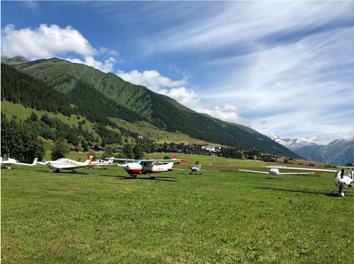
Fly-in der Motorflieger vom Birrfeld, verbunden mit einem feinen Raclette in der Erholungs- und Freizeitanlage Münster (EFAM)