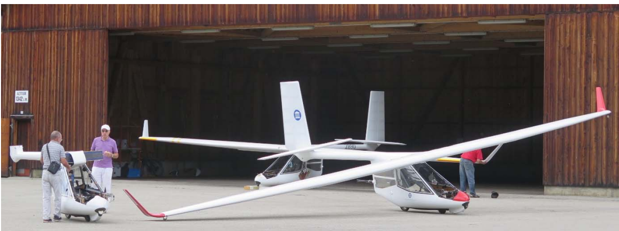
Die elektrobetriebenen Ultralights vom Typ Archaeopteryx und Swiftlight-E konnten über Nacht im Holzhangar hangriert werden.