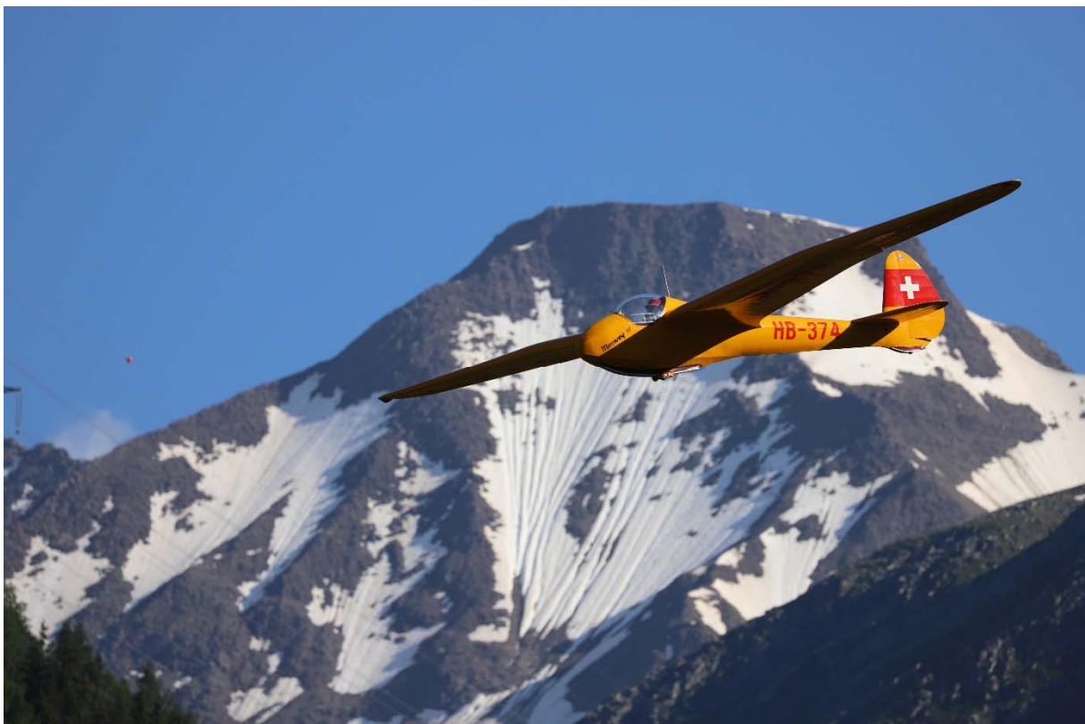
Mosway III HB-374 mit Pilot Jürg Weiss im Endanflug auf Münster.