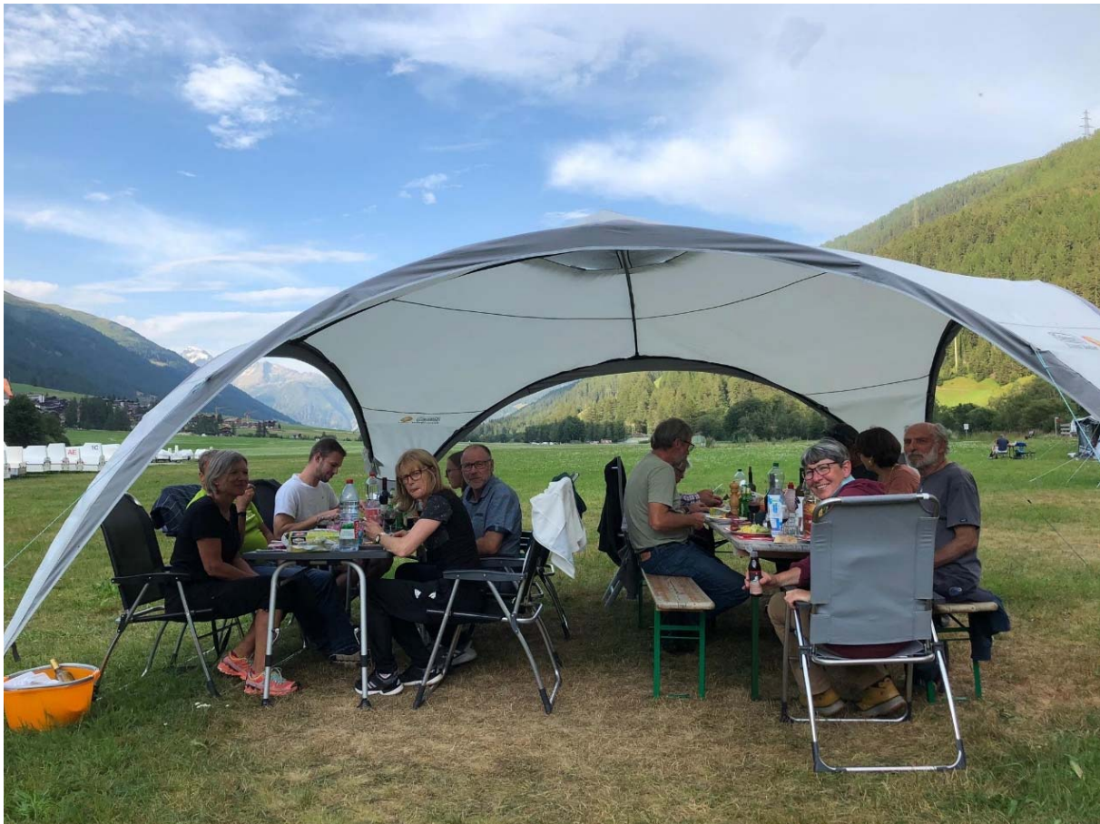
Nach einem tollen Flugtag genießt die SG Winterthur das wohlverdiente Nachtessen auf dem Campingplatz.