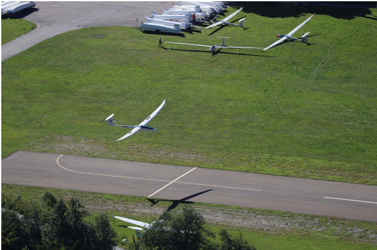
Landung Duo Discus der Segelfluggruppe Neuchâtel auf Piste 05

Auch immer mehr Motorflieger finden den Weg ins Goms und landen auf dem Flugplatz Münster. Im Jahr 2020 besuchten uns rund 230 Motorflieger und bezahlten Landegebühren in der Höhe von 5'500.- Fr.