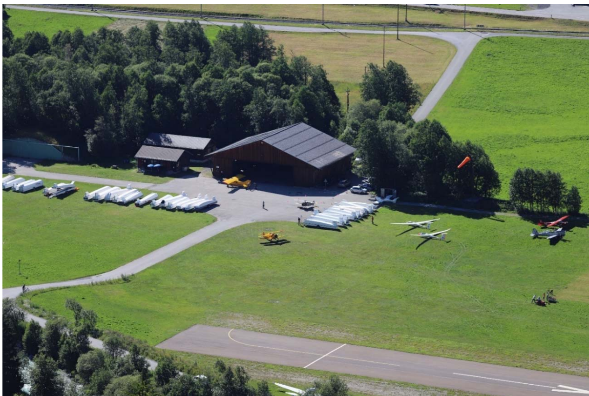
Emsiges Treiben auf dem Flugplatz und rekordverdächtige 27 Segelflugzeuganhänger auf Platz

Der Flugbetrieb auf dem Flugplatz Münster verlief zu jeder Zeit geordnet, sicher und diszipliniert. Die Flugplatzgenossenschaft Münster bedankt sich bei allen Pilotinnen und Piloten für diese tolle Leistung. Besonders hervorheben möchten wir die Schlepppiloten und die Lagerleiter, die dank ihrer Übersicht und Professionalität sehr viel für den reibungslosen Flugbetrieb beigetragen haben.