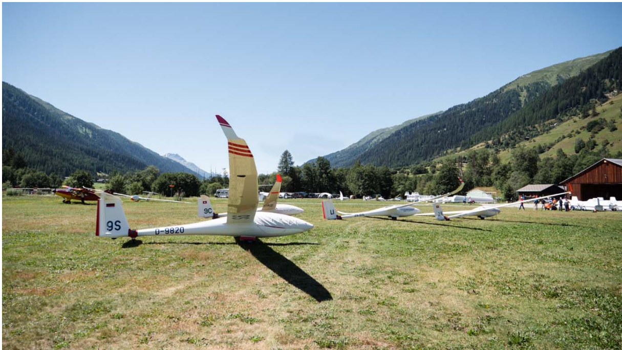
Segelflugzeuge bereit für den Start am Pistenkopf 05