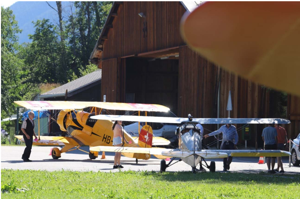
Mehrere Oldtimer zu Besuch in Münster

Auch immer mehr Motorflieger finden den Weg ins Goms und landen auf dem Flugplatz Münster. Im Jahr 2020 besuchten uns rund 230 Motorflieger und bezahlten Landegebühren in der Höhe von 5'500.- Fr.